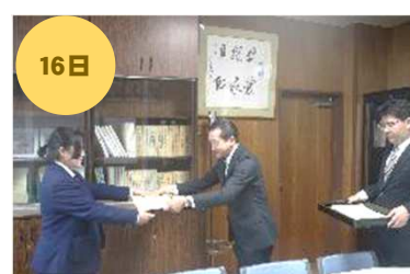
「税に関する高校生作文」入賞