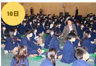
学びフォーラム「午前の部」