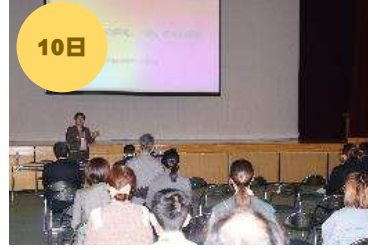
学びフォーラム「午後の部」