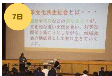
第2学年国際理解講演会