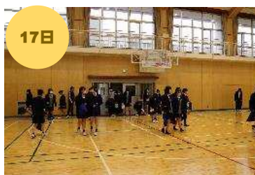
秋季防災避難訓練