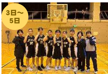
バスケットボール新人大会