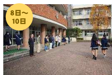
PTAマナーアップ・一声運動