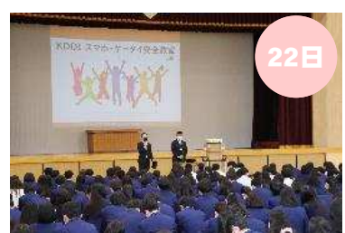
生徒向け情報モラル講座