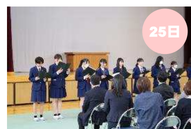
教育振興会・PTA総会