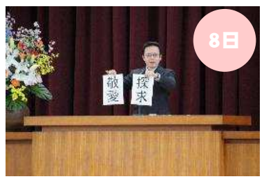
着任式・新任式・始業式